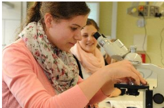
Gesundheit und Soziales