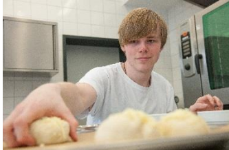
Ernährung und Versorgung