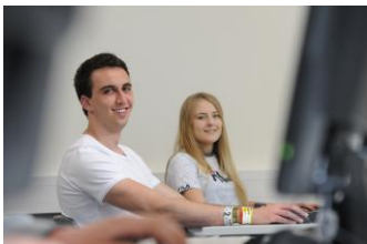
Wirtschaft und Verwaltung / Informatik