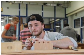
Handwerk und Technik